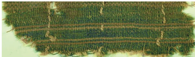
חדי עין יכולים להבחין גם בעין בלתי מזוינת את צבע הכחול שמבצבץ באריג