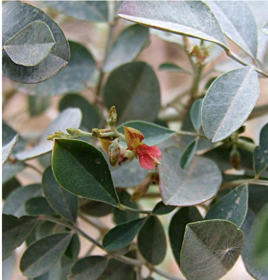
ניל מכסיף (הצבעים) צילמה: שרה גולד – צמח השדה