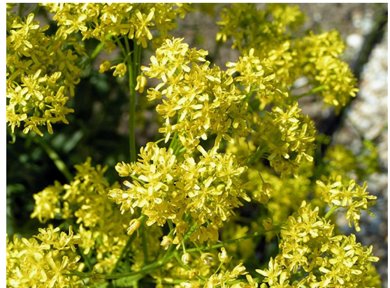
איסטיס – פריחה