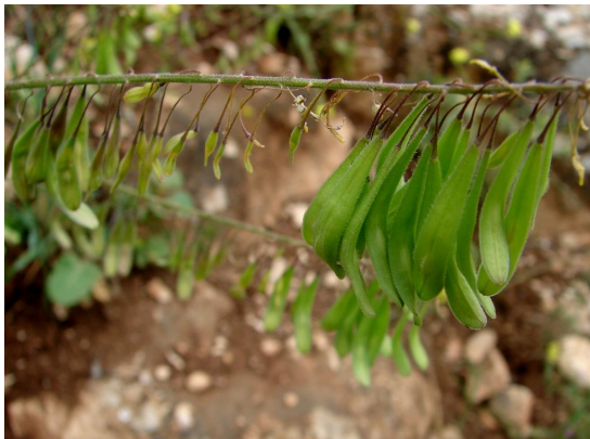
איסטיס - תרמילים

אסטיס הצבעים הוא מין במשפחת המצליבים הקרוב לאסטיס המצוי. האסטיס המצוי נפוץ מאד בארץ ויוצר יחד עם החרדל הלבן והלפתית משטחי פריחה צהובים. אופן גידולו של אסטיס הצבעים מתאים למתואר במשנה בכלאים (פ"ב מ"ה) העוסקת בספיחי אסטיס משום שמקובל לגדל את הצמח בשדות במשך 4-5 שנים ולהניח לו להתרבות מזרעים. מוצא האיסטיס הוא בערבות ובאיזורים המדבריים של הקווקז, מרכז אסיה עד מזרח סיביר ומערב אסיה. היום הוא נפוץ בדרום מזרח וחלקים ממרכז אירופה. בעת העתיקה גידלו אותו ברחבי אירופה ובמיוחד במערב ובדרום.